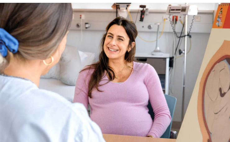
Hebammensprechstunde im LIMMI

VM: ... für das wir im Falle eines Falles natürlich ohnehin gewappnet wären. Dafür werden wir ausgebildet, solche Szenarien werden regelmässig geübt. Wir verfügen zudem über modernste Technik und angemessene Einrichtungen.