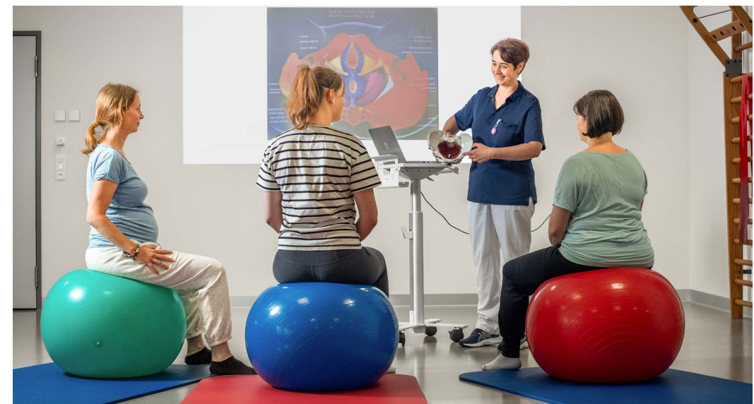
Geburtsvorbereitungskurs im LIMMI