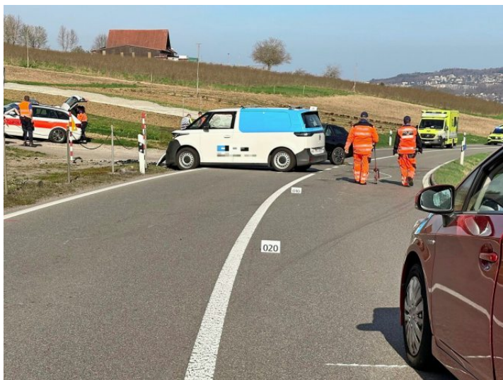
Der Unfall auf der Aargauerstrasse zwischen Oberwil-Lieli und Birmensdorf hatte sieben Verletzte zur Folge.

Rein geografisch gesehen hatten die aufgebauten Ambulanzen also einen um mehrere Minuten längeren Anfahrtsweg als näher gelegene Standorte wie beispielsweise die TCS Ambulance Aargau in Berikon. Diese hätte ebenfalls Fahrzeuge verfügbar gehabt zu jenem Zeitpunkt. Stellt sich die Frage, nach welchen Kriterien entschieden wird, aus welchen Kantonen Rettungsmittel beigezogen wer-